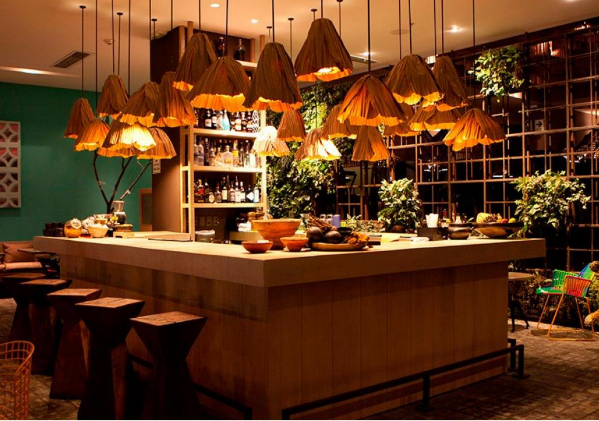
Aperitivos en Restaurante Amazónico