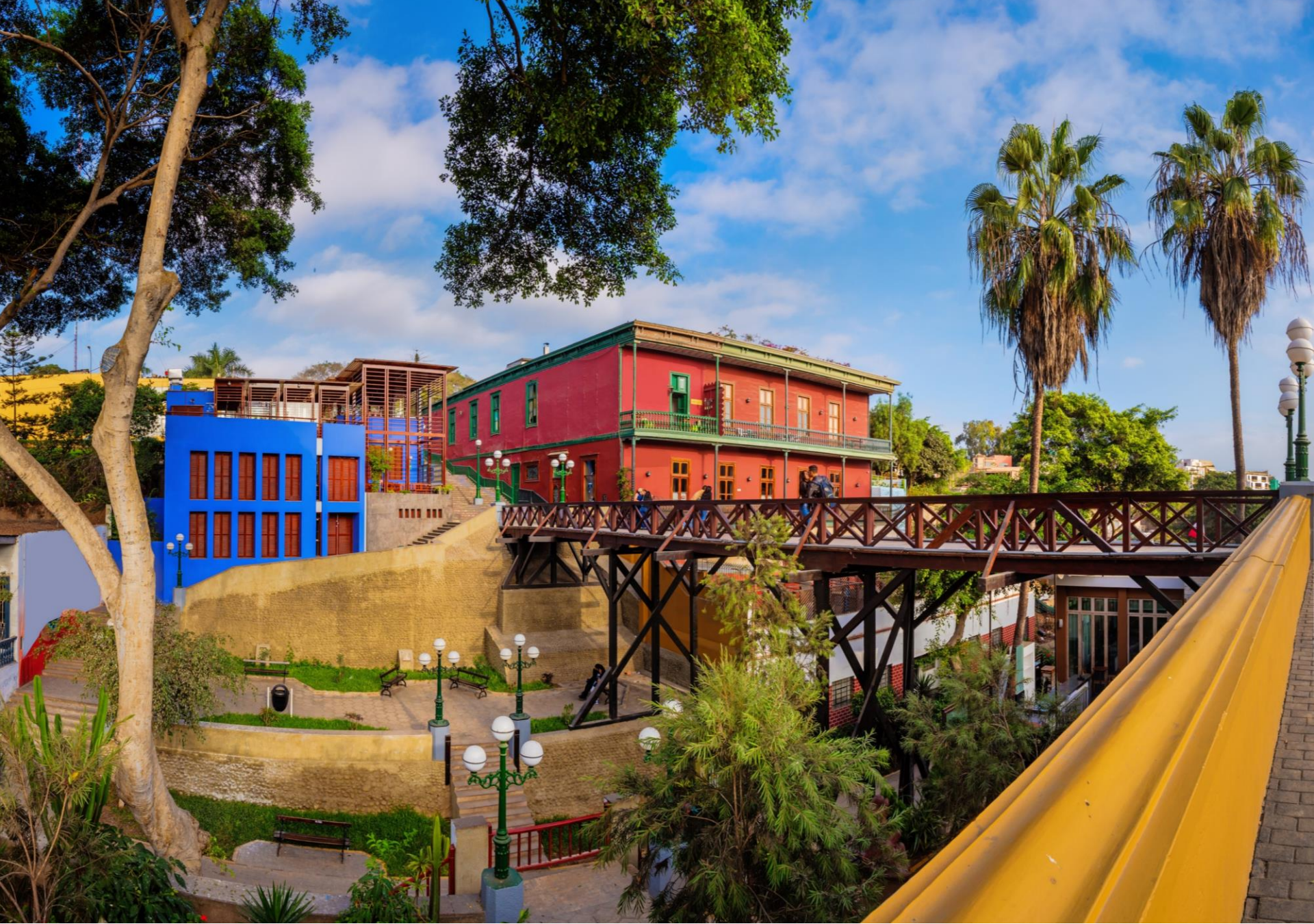
Tour del Distrito Bohemio y Colonial de Barranco