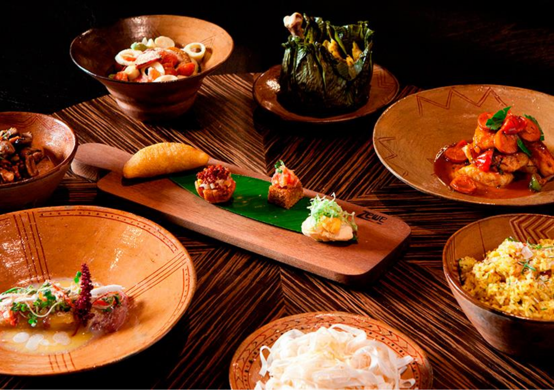
Aperitivos en Restaurante Amazónico