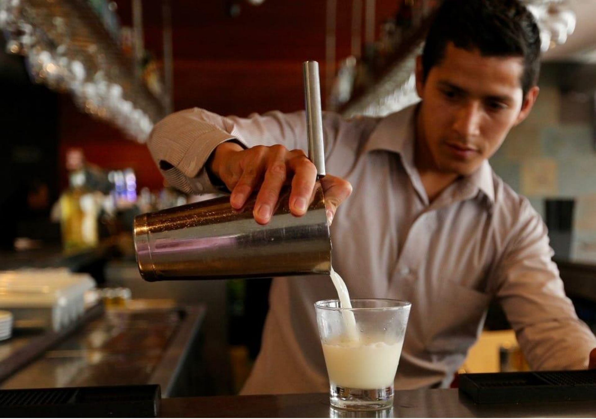
Demostración de Pisco Sour en Restaurante (con vista al mar)