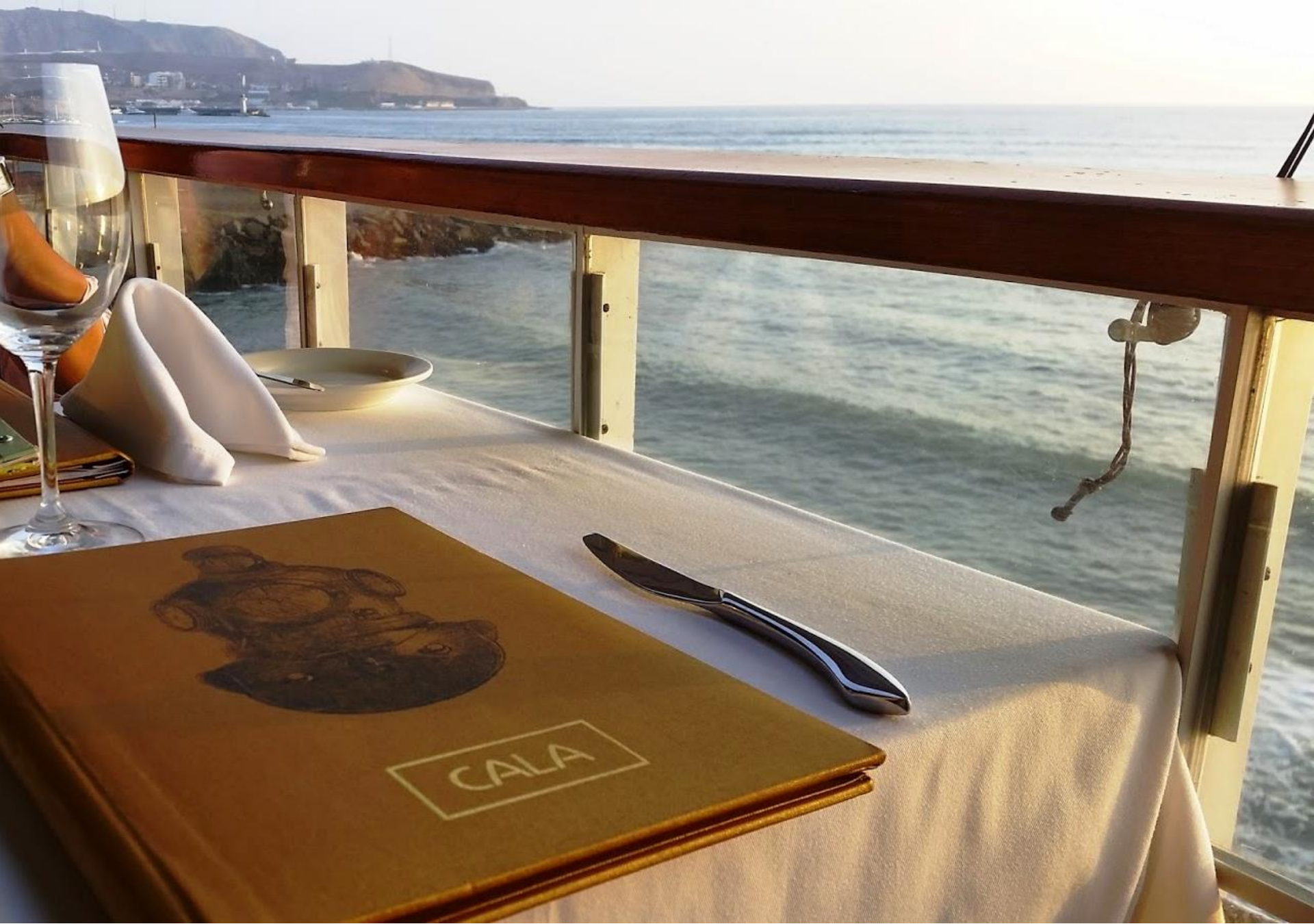
Demostración de Pisco Sour en Restaurante (con vista al mar)