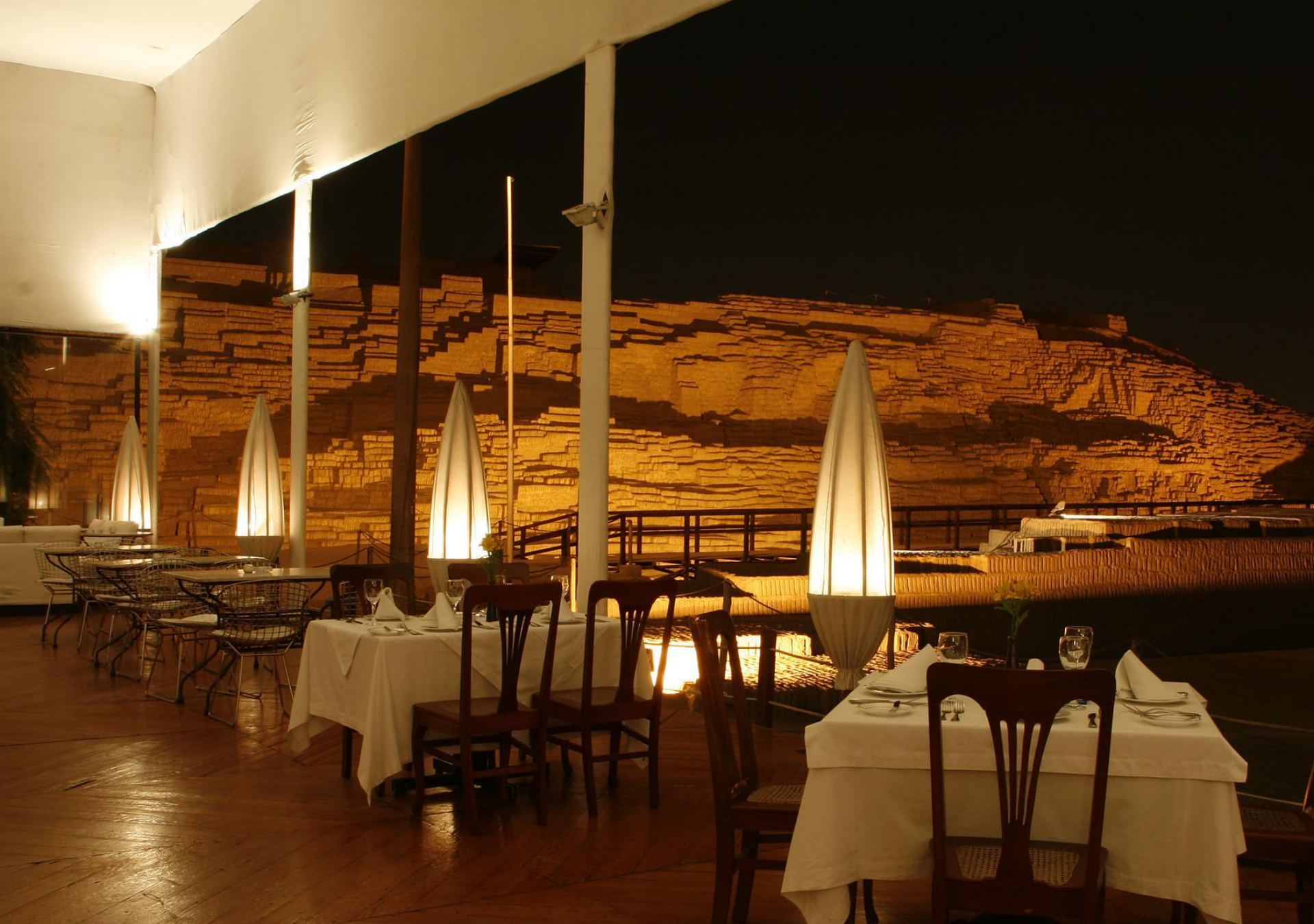
Cena Peruana gourmet en medio de las ruinas preincaicas de la Huaca Pucllana