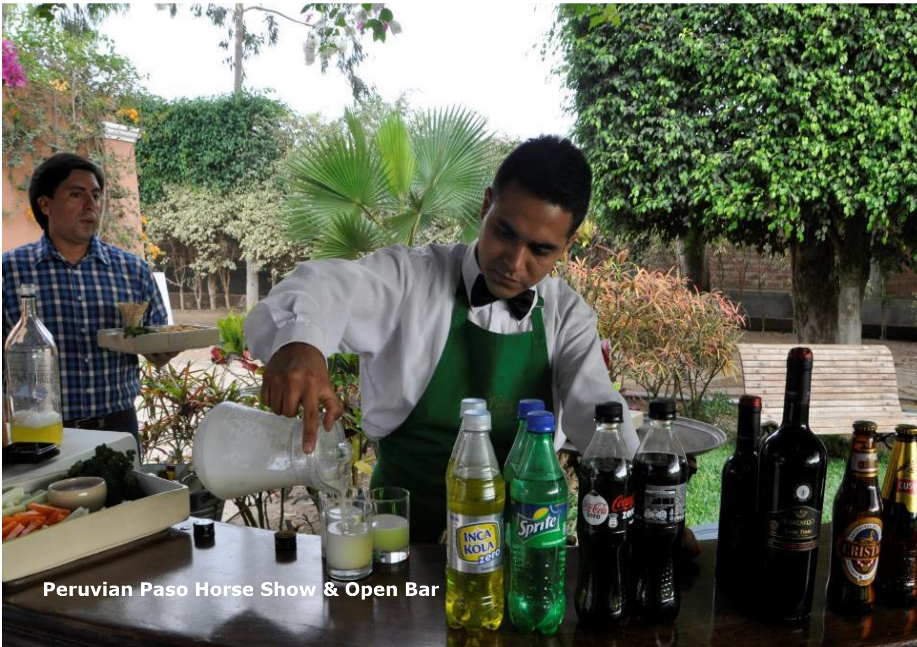
Peruvian Paso Horse Show & Open Bar