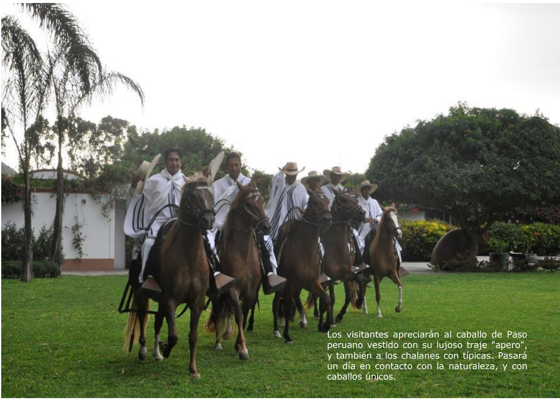
Los visitantes apreciarán al caballo de Paso peruano vestido con su lujoso traje "apero", y también a los chalanos con típicas. Pasará un día en contacto con la naturaleza, y con caballos únicos.