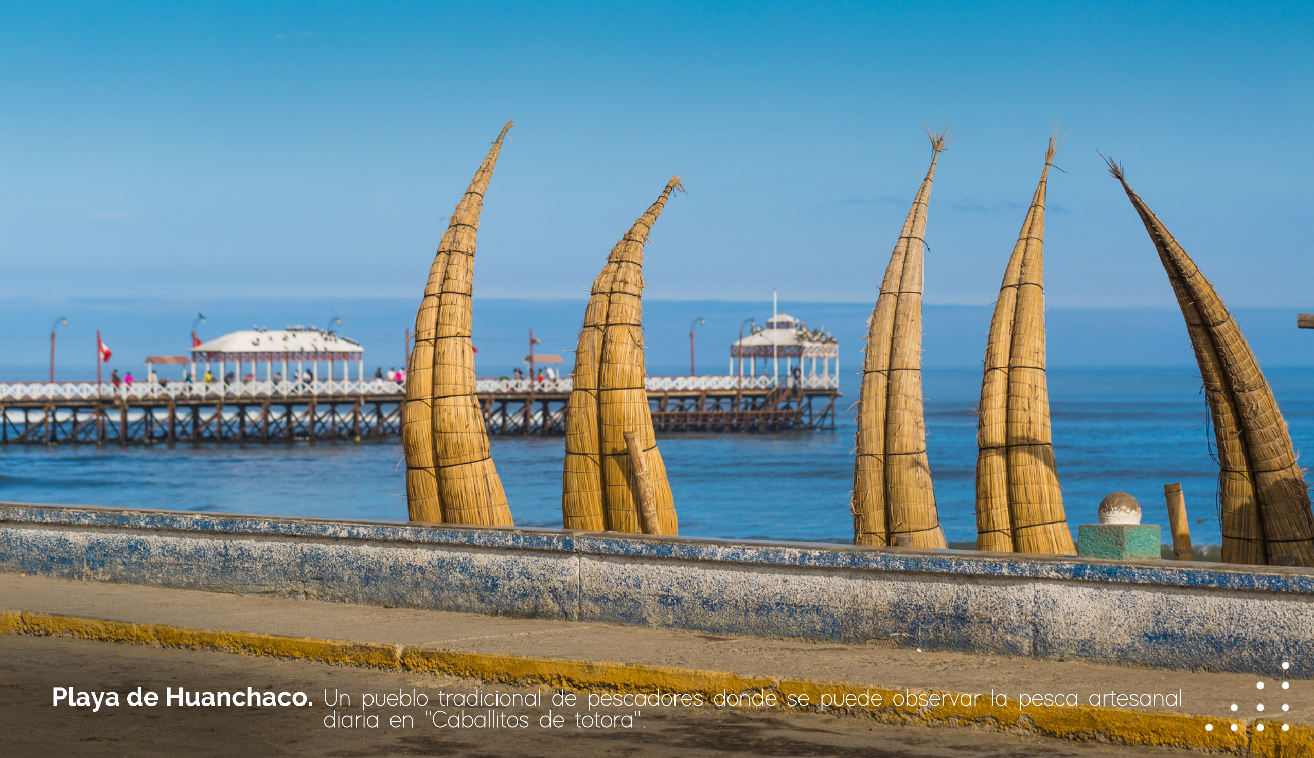
Playa de Huanchaco. Un pueblo tradicional de pescadores donde se puede observar la pesca artesanal diaria en "Caballitos de totora".