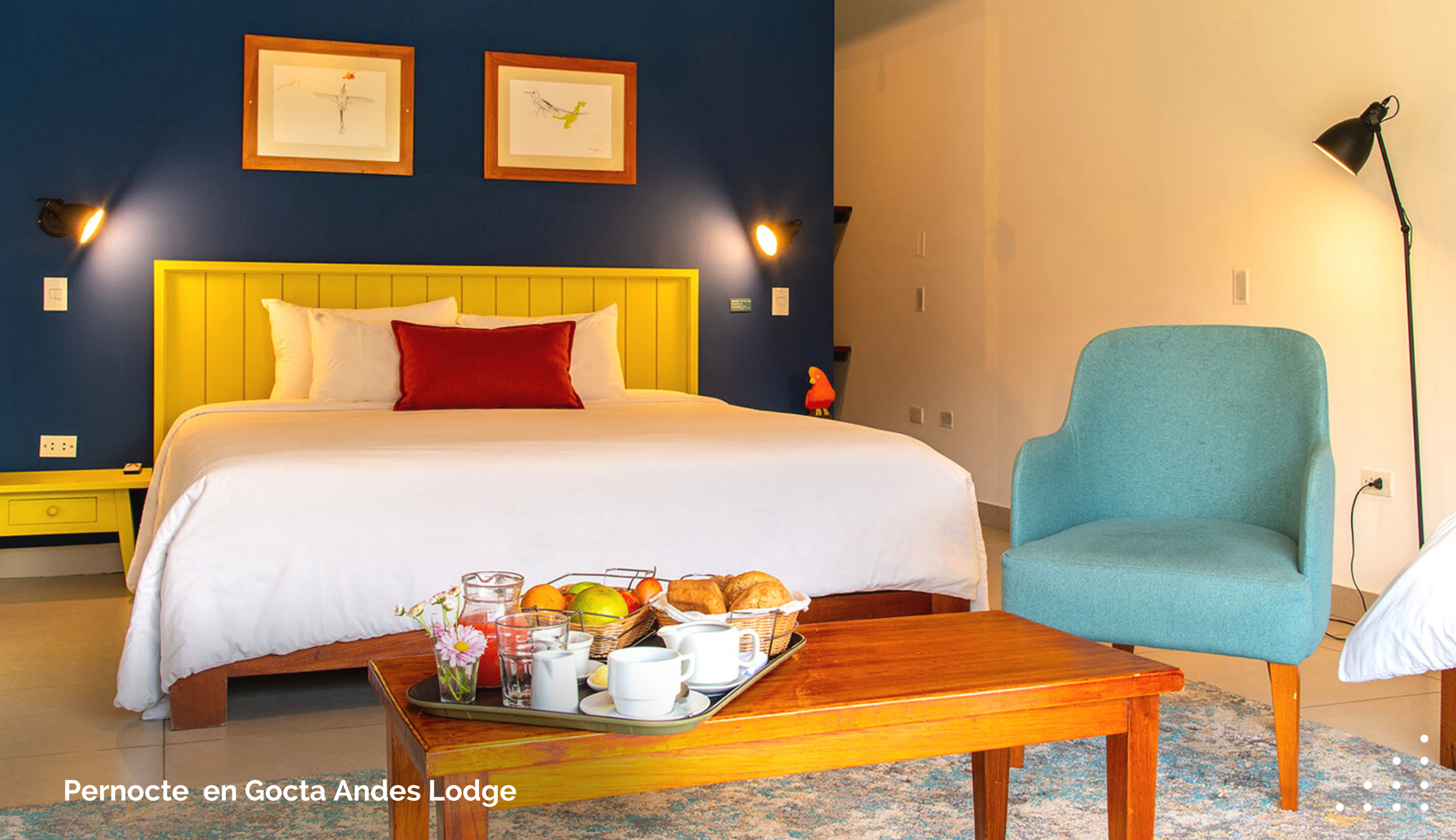
Pernocte en Gocta Andes Lodge