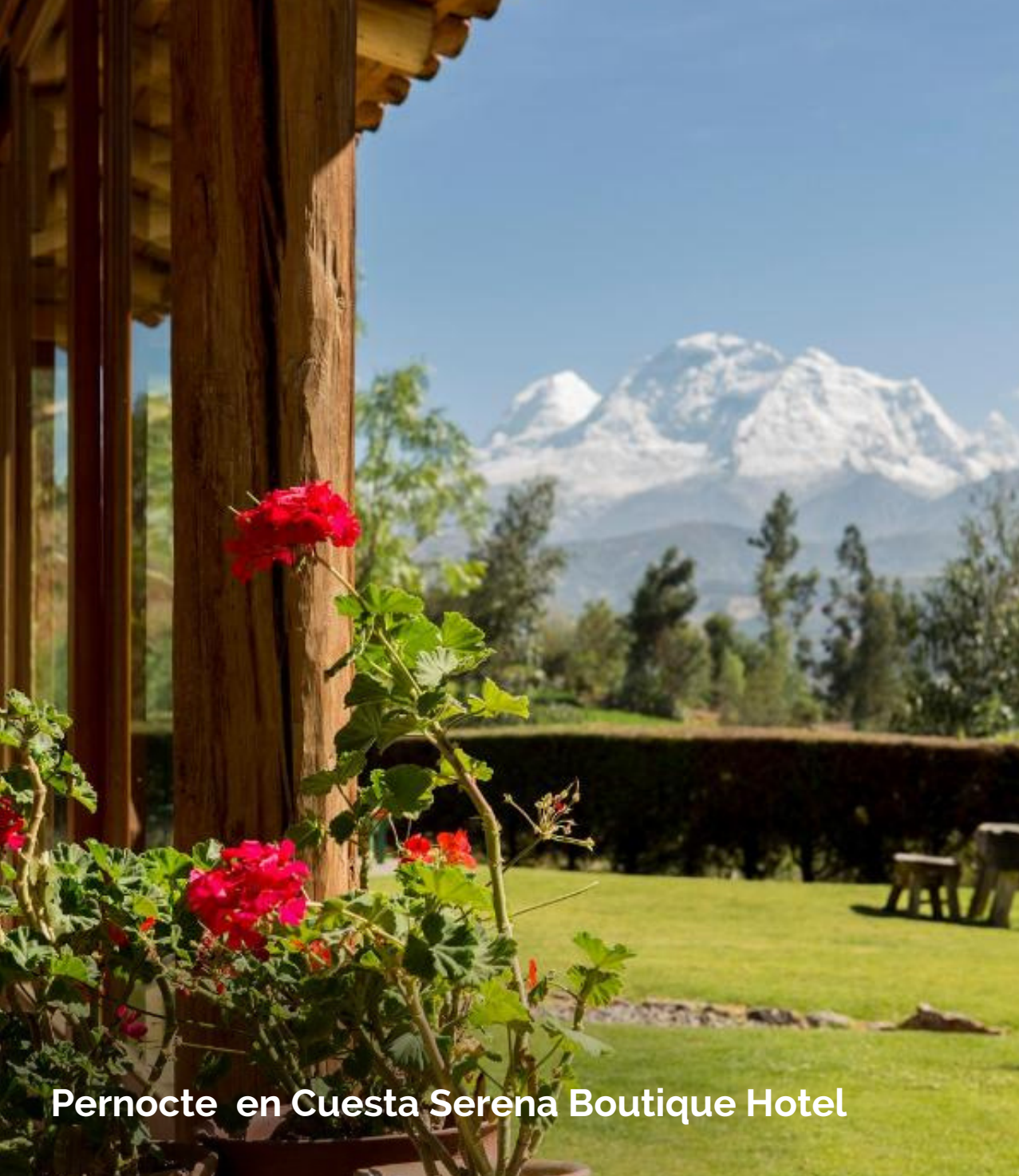
Pernocte en Cuesta Serena Boutique Hotel