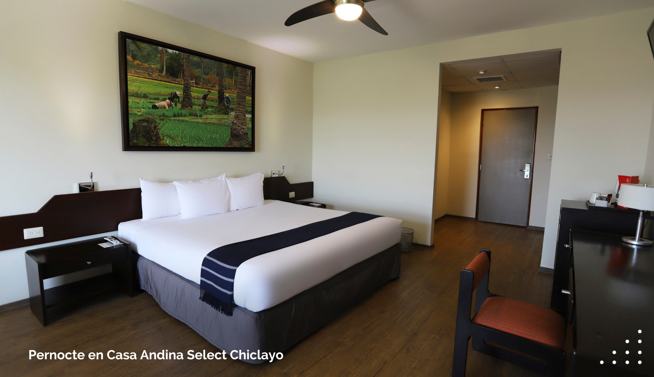
Pernocte en Casa Andina Select Chiclayo