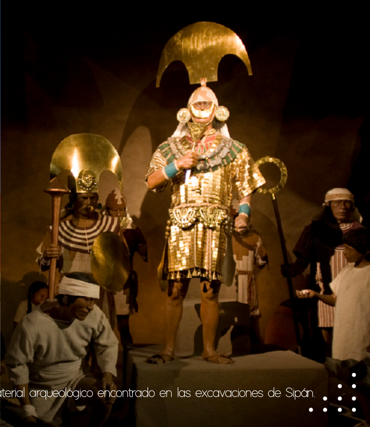
Museo Tumbas Reales de Sipán. Conserva todo el material arqueológico encontrado en las excavaciones de Sipán.