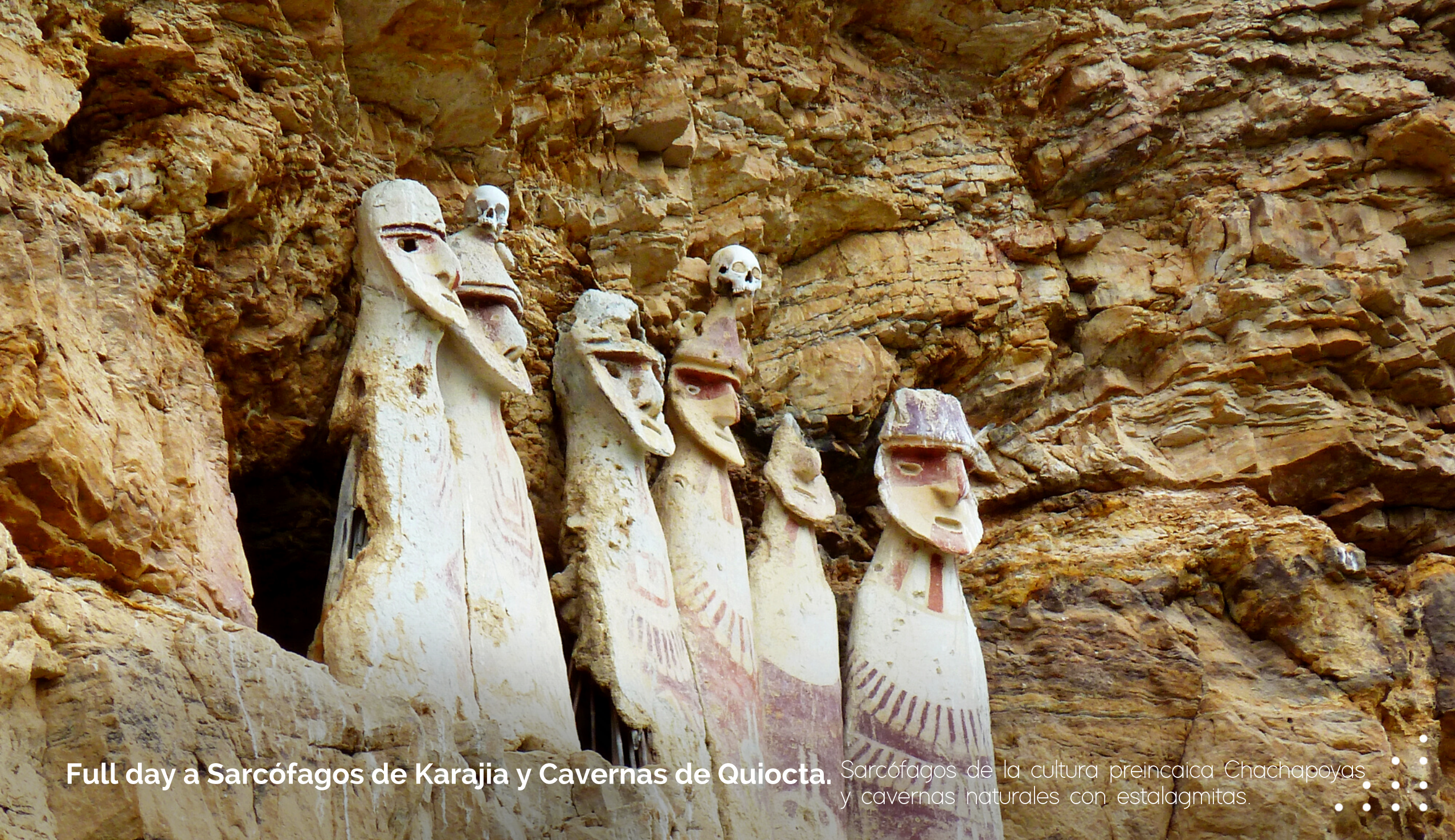
Full day a Sarcófagos de Karajia y Cavernas de Quiocta. Sarcófagos de la cultura preincaica Chachapoyas y cavernas naturales con estalagmitas.