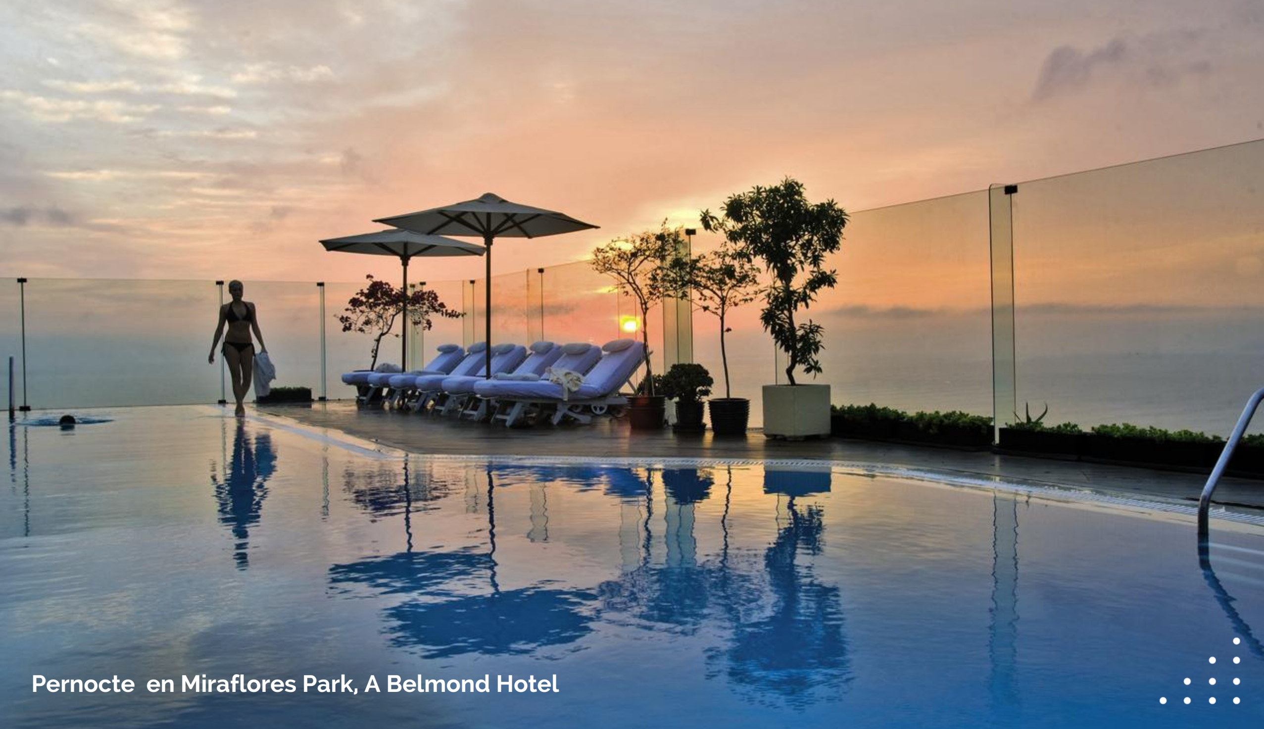
Pernocte en Miraflores Park, A Belmond Hotel