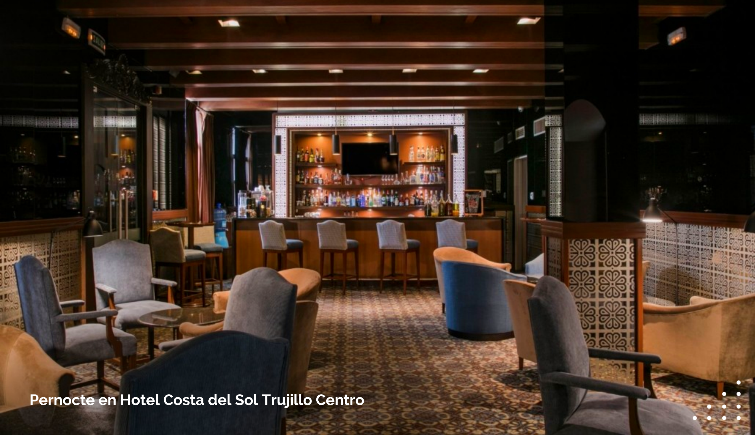
Pernocte en Hotel Costa del Sol Trujillo Centro