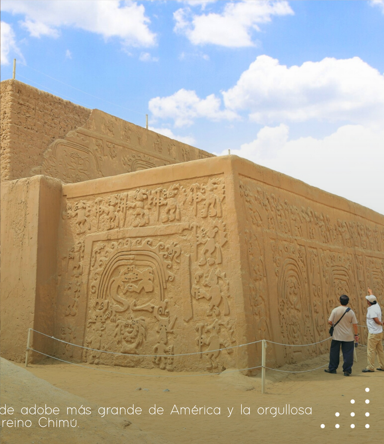
Complejo arqueológico de Chan Chan. La ciudad de adobe más grande de América y la orgullosa capital del reino Chimú.