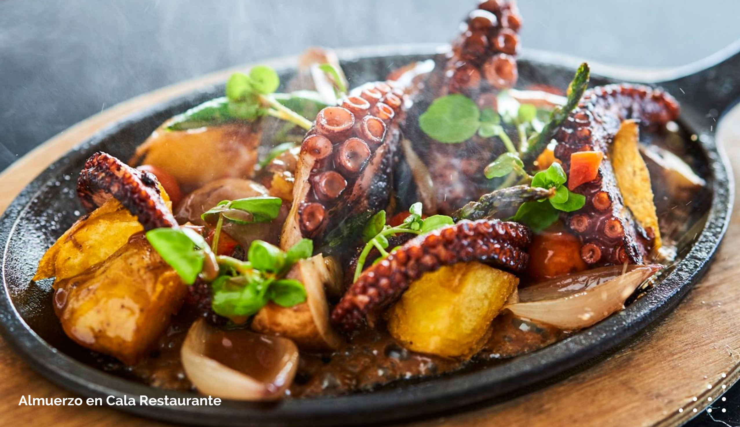
Almuerzo en Cala Restaurante