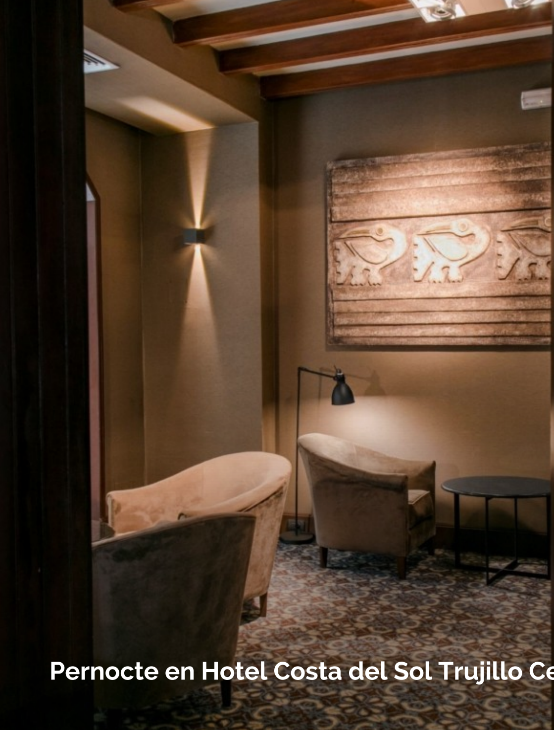
Pernocte en Hotel Costa del Sol Trujillo Centro