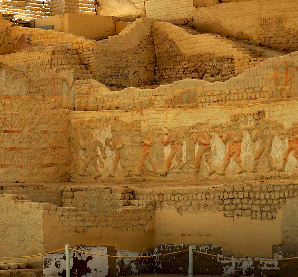
Complejo arqueológico El Brujo. Uno de los centros religiosos y políticos más importantes de la Cultura Moche.