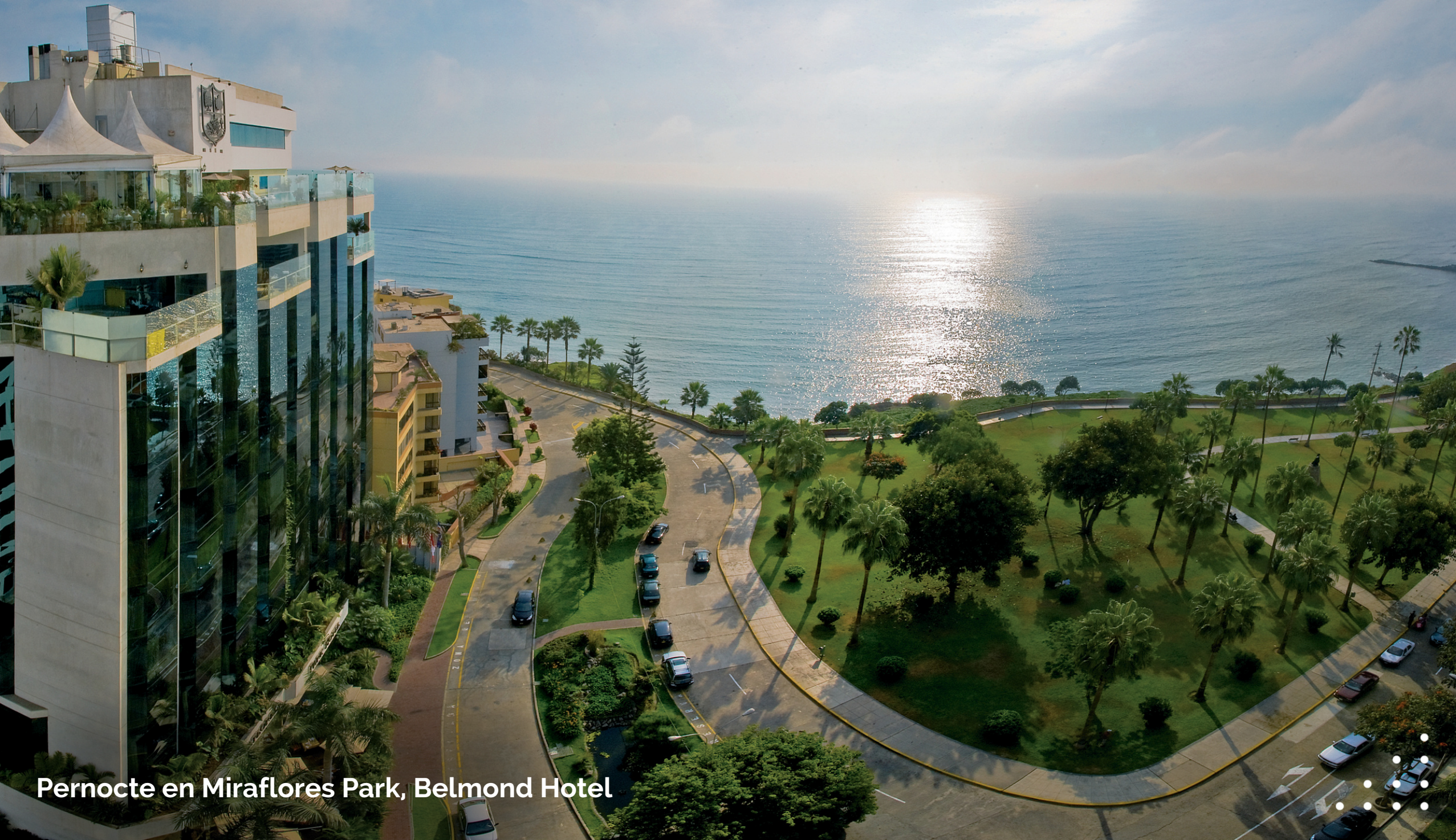
Pernocte en Miraflores Park, Belmond Hotel