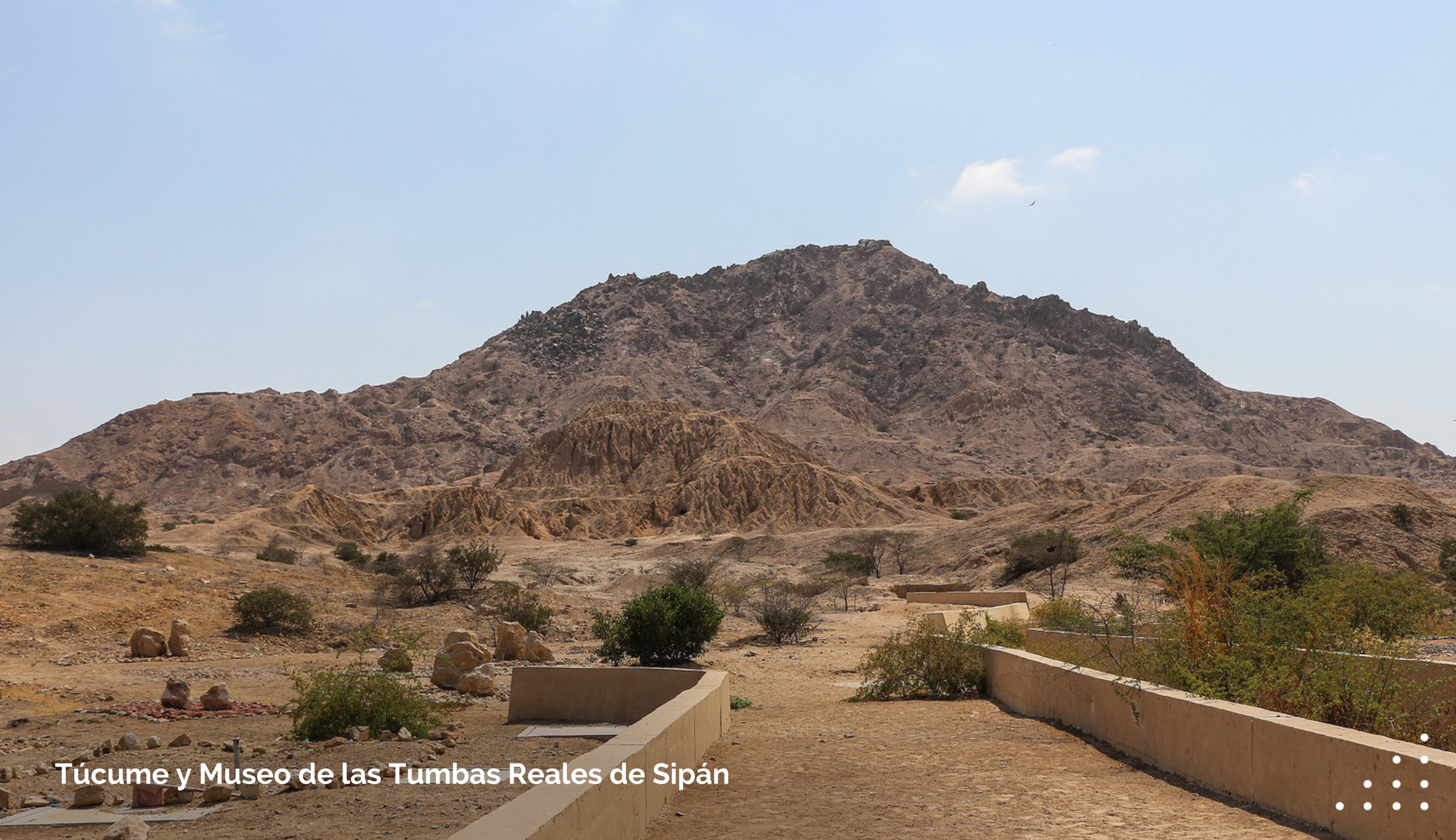
Túcume y Museo de las Tumbas Reales de Sipán