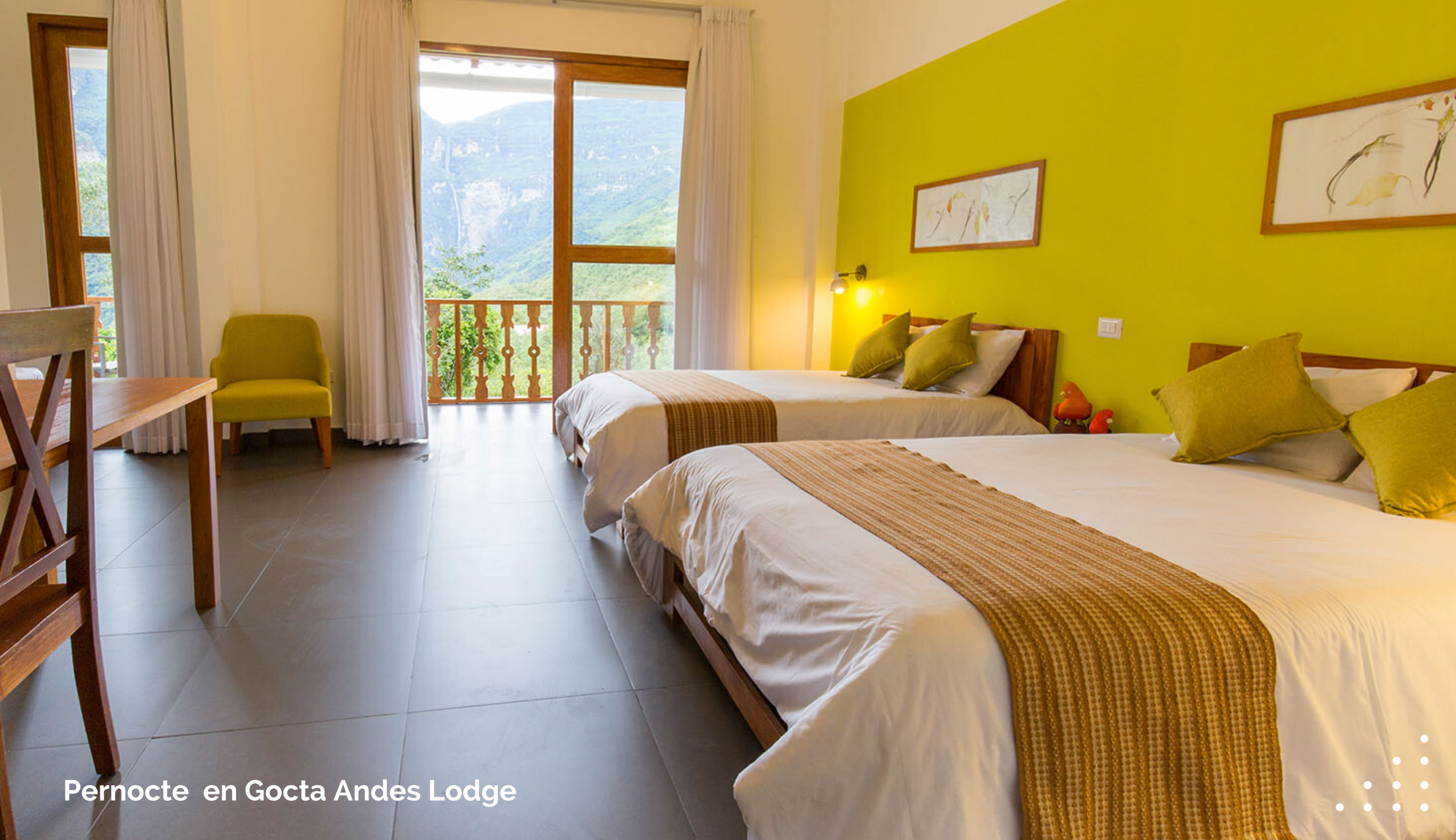
Pernocte en Gocta Andes Lodge