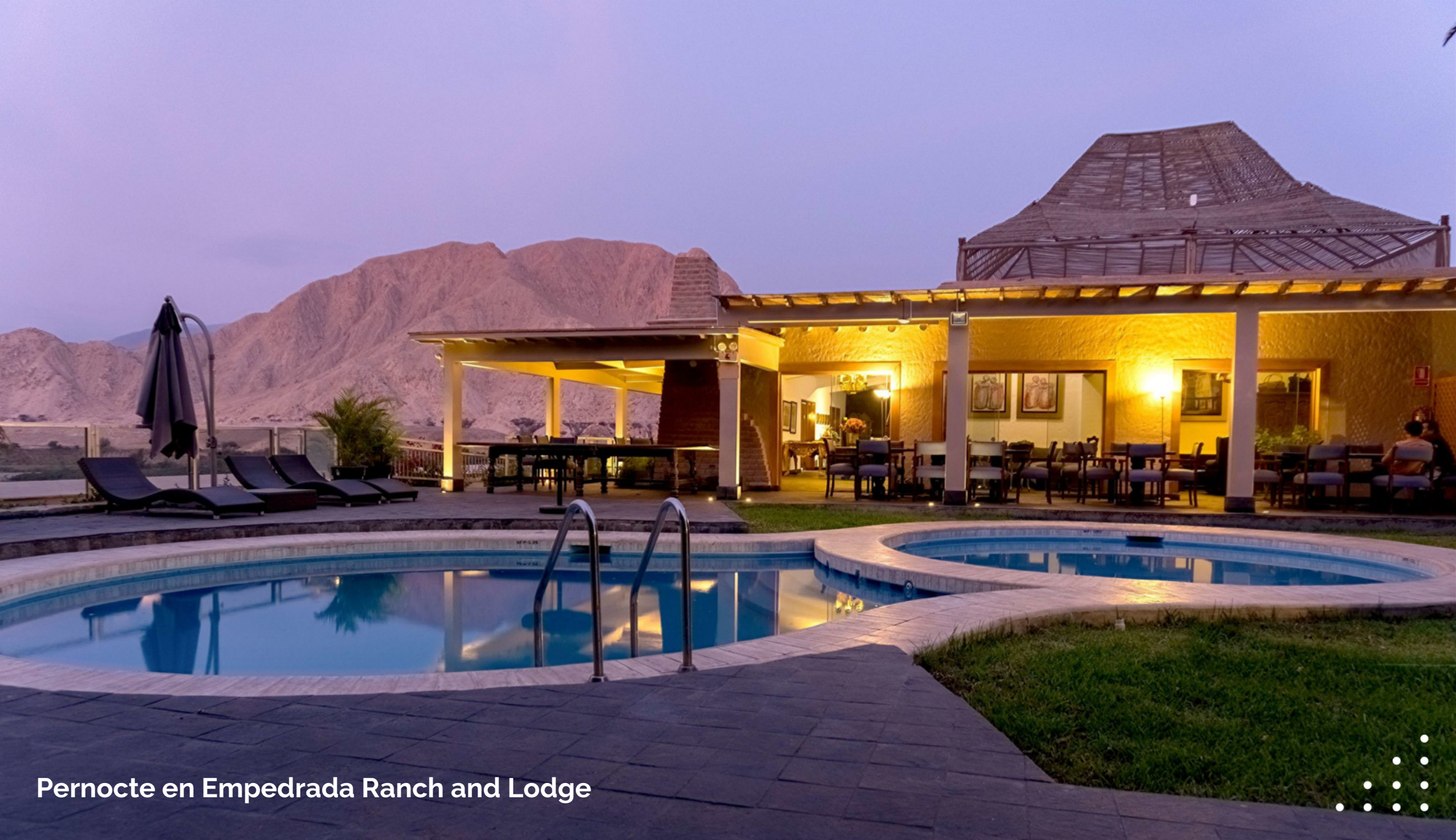
Pernocte en Empedrada Ranch and Lodge